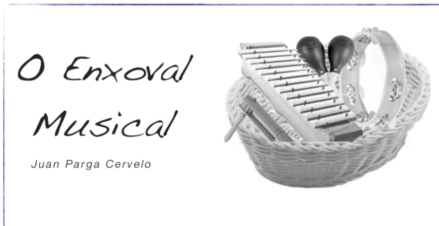
cartel do curso